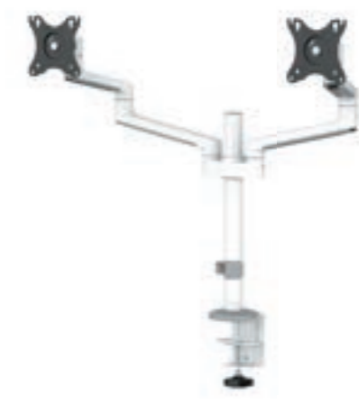
DS60-425BL1 / WH1 Bildschirmgröße: 17-27" Kapazität: 8 kg