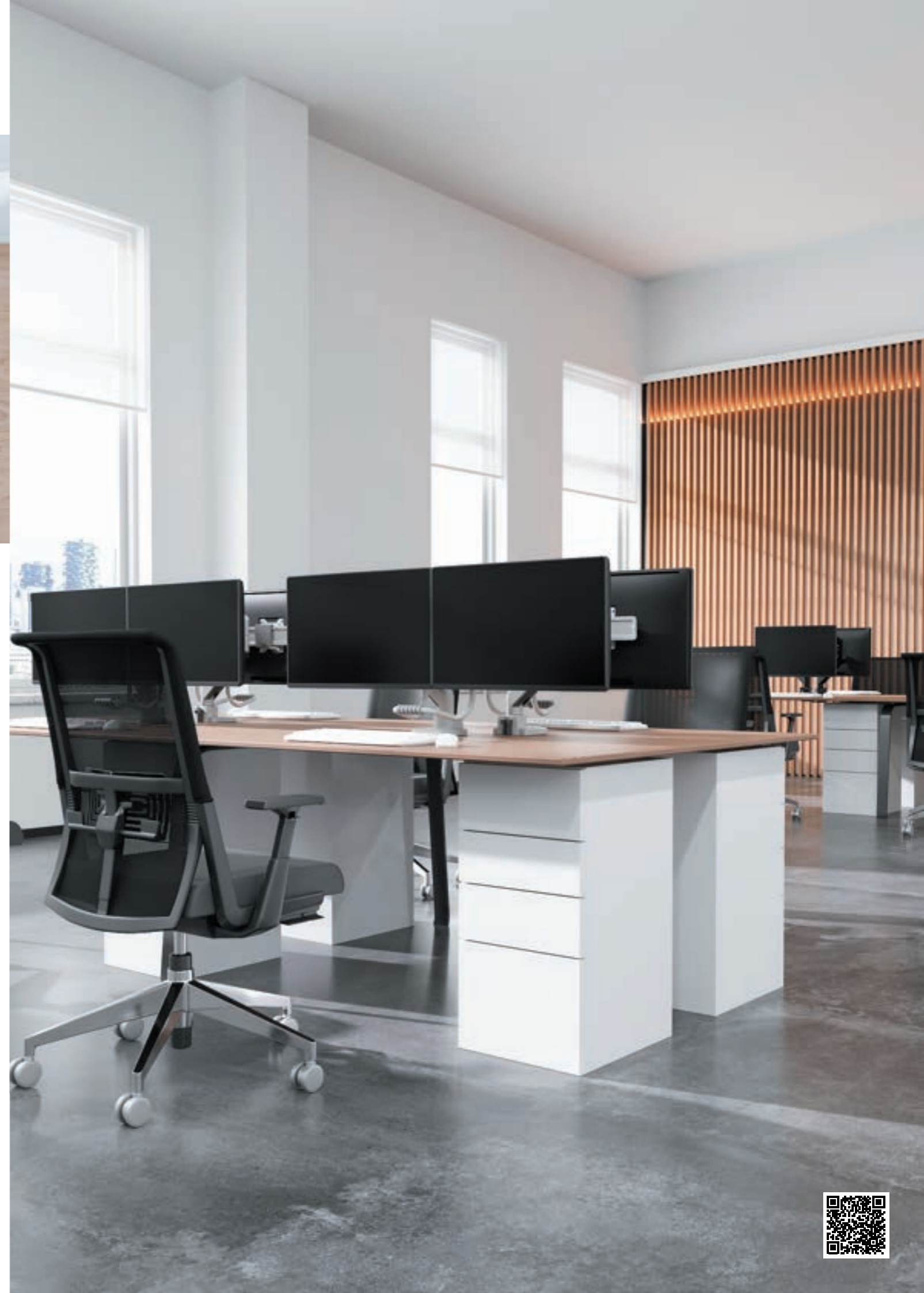
DS75-450BL2 / WH2 Bildschirmgröße: 17-32" Kapazität: 8 kg (2x)