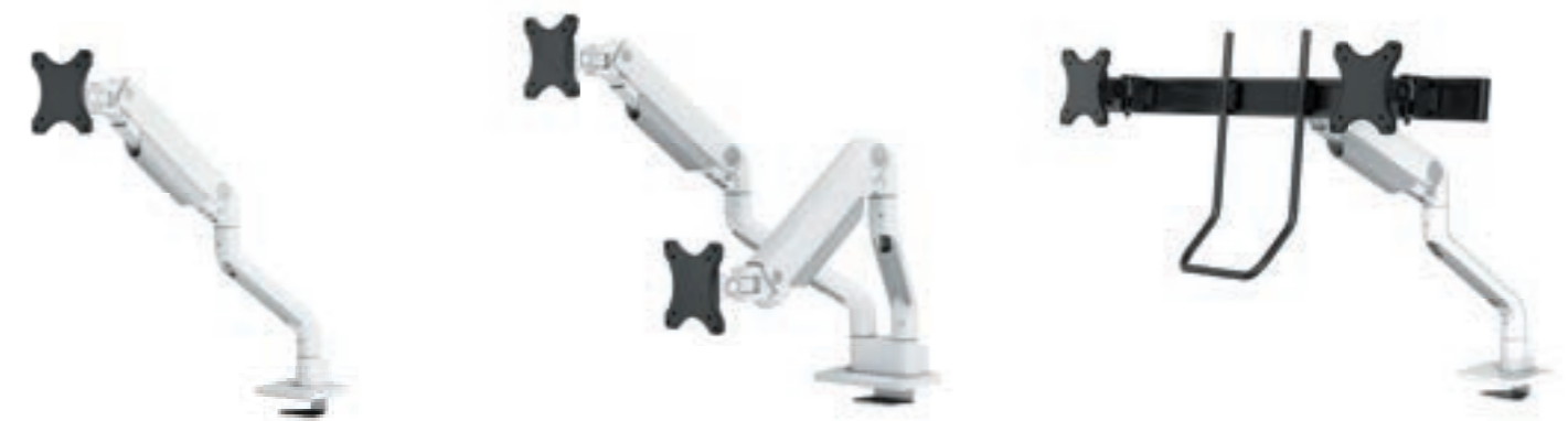
DS70S-950BL1 / WH1 Bildschirmgröße: 17-49" Kapazität: 18 kg (Curved 15 kg) Verstärkter Kopf